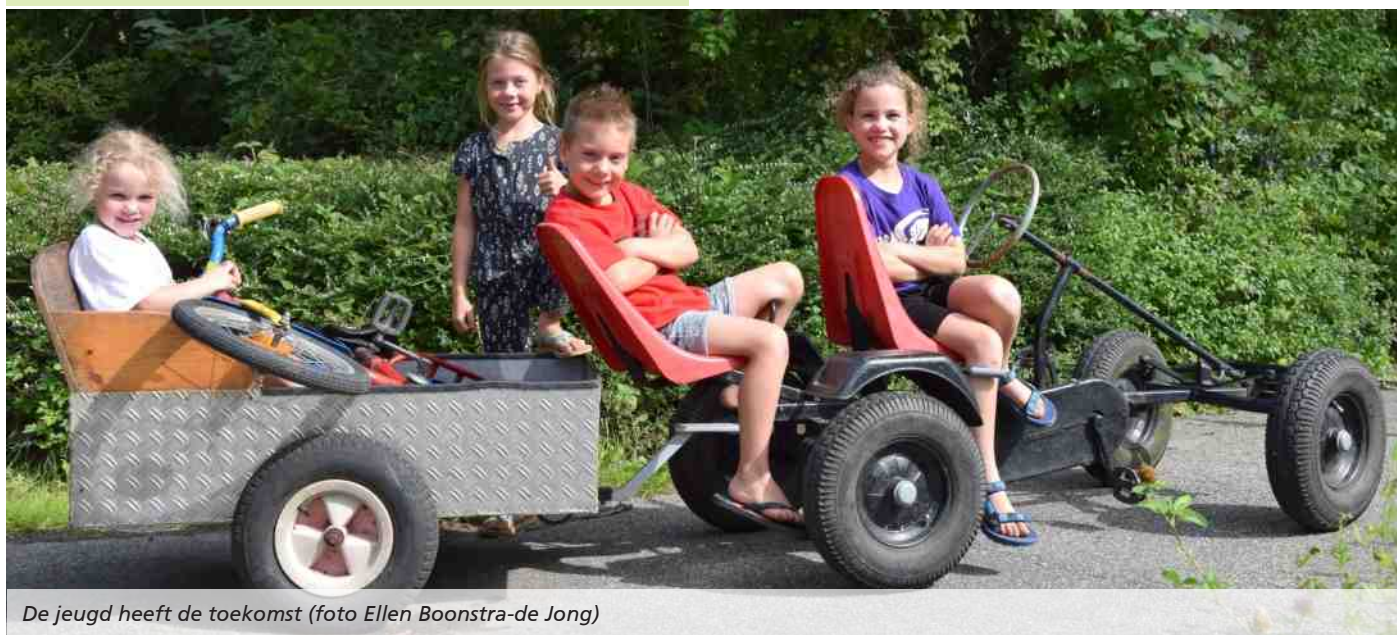
De jeugd heeft de toekomst