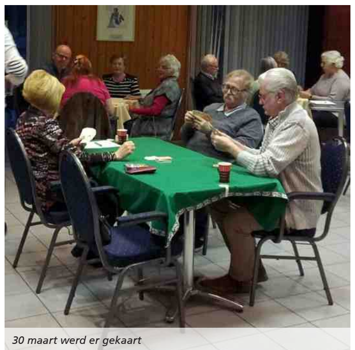
30 maart werd er gekaart