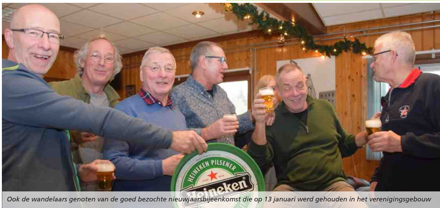
Ook de wandelaars genoten van de goed bezochte nieuwjaarsbijeenkomst die op 13 januari werd gehouden in het verenigingsgebouw

Namens het bestuur en alle leden van Thurlede wens ik de ...26... nieuwe tuinders van 2017 veel tuinplezier in 2018 toe. Frank van tuin 71 (verkoop tuinen)