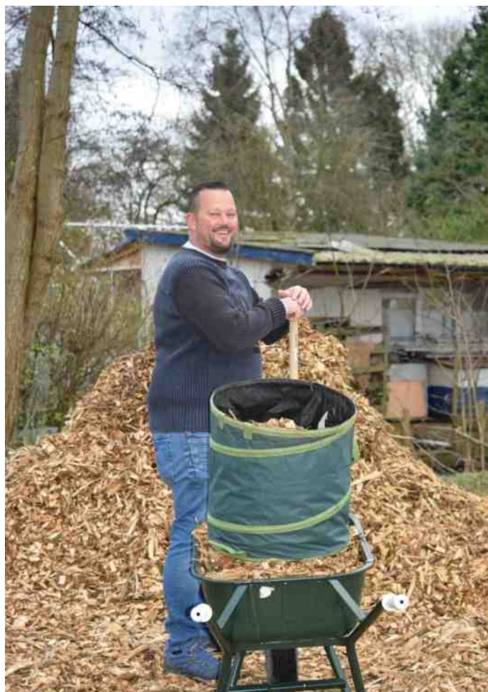
De houtsnippers vinden weer gretig aftrek

Op 5 mei en op 12 mei kunnen de spelletjesfanaten hun hart ophalen. Op 5 mei is er bingo (deelname: 12.50 euro) en op 12 mei een quiz (deelname: 1.50 euro). Beide avonden worden gehouden in het verenigingsgebouw en beginnen om 20.00 uur. Inloop om 19.30 uur.