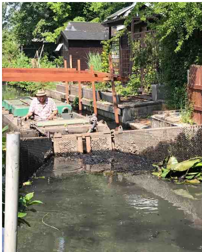
Nieuw leven krijgt weer kans in de uitgebaggerde sloten