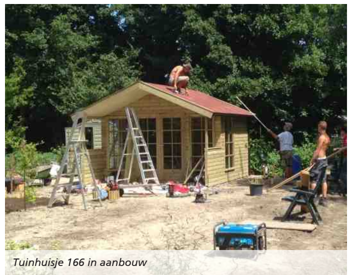
Tuinhuisje 166 in aanbouw