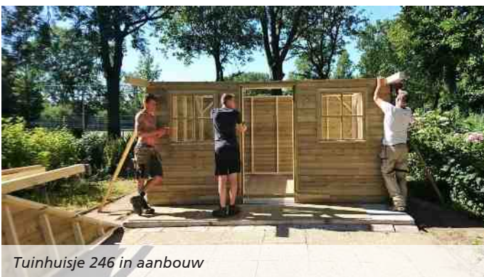
Tuinhuisje 246 in aanbouw