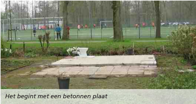
Het begint met een betonnen plaat