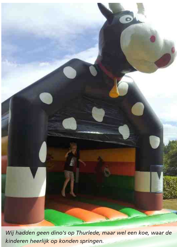
Wij hadden geen dino's op Thurlede, maar wel een koe, waar de kinderen heerlijk op konden springen.