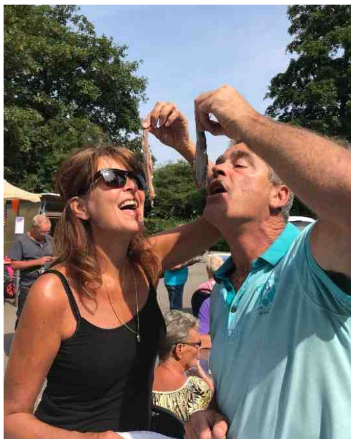
Mooi initiatief van het bestuur. Samen haring happen.